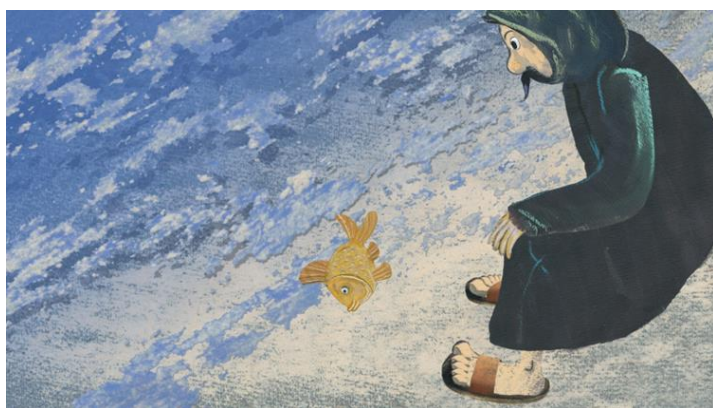
„Rybak na dnie morza” reż. Leszek Marek Gałysz, 12’ / Kuchnia Filmowa 2011

godz. 11:30 – zestaw filmów animowanych w ramach retrospektywy Leszka Marka Gałysza z okazji 75. rocznicy urodzin twórcy, grupa wiekowa: klasy I-IV, czas trwania projekcji i animacji wokół filmów: 48 minut + około 40 minut